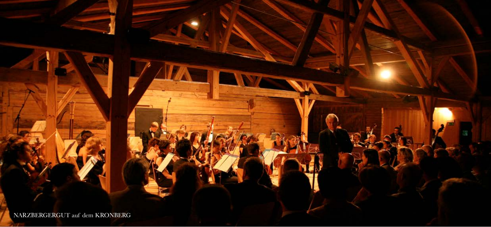
NARZBERGERGUT auf dem KRONBERG